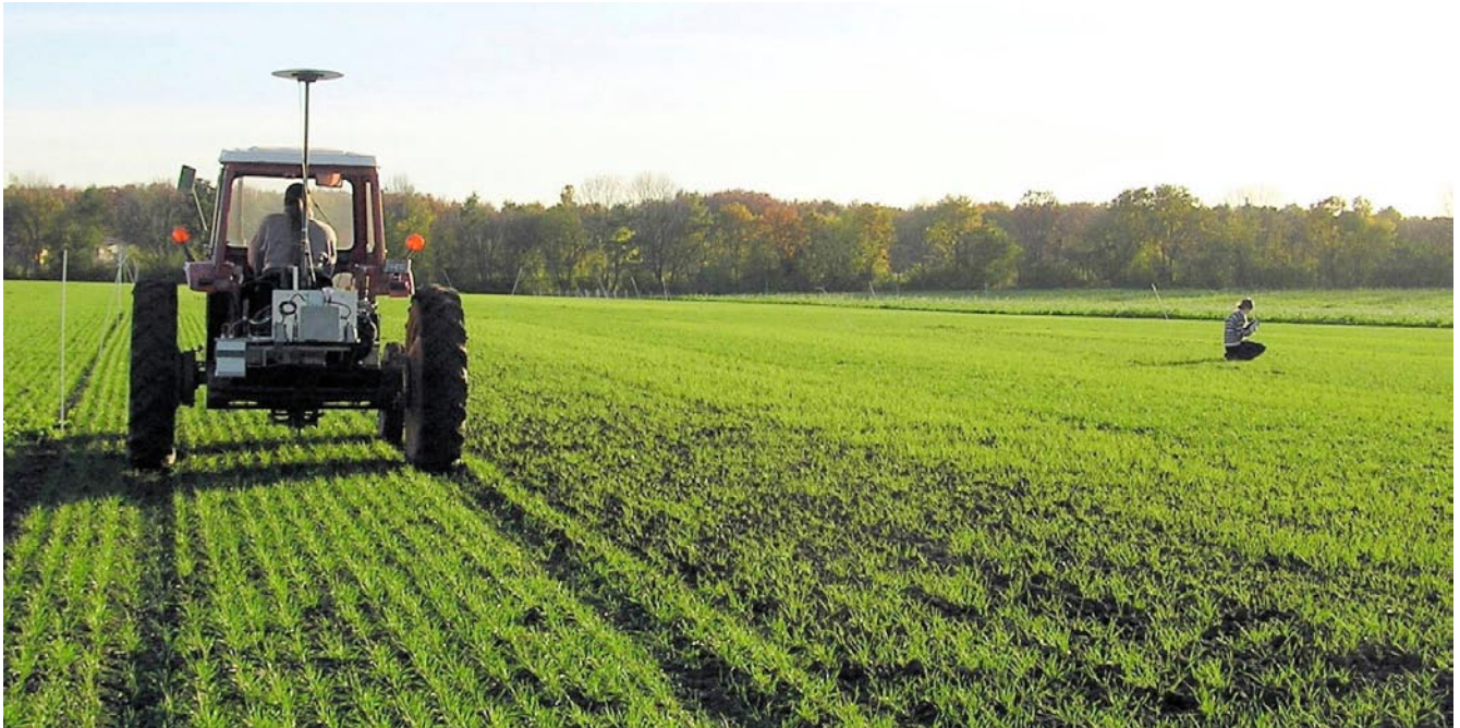
Automatisk kortlægning af afgrøde og ukrudt ved hjælp af sensorer, billedbehandling og GPS (til venstre) og manuel optælling af ukrudt (til højre).